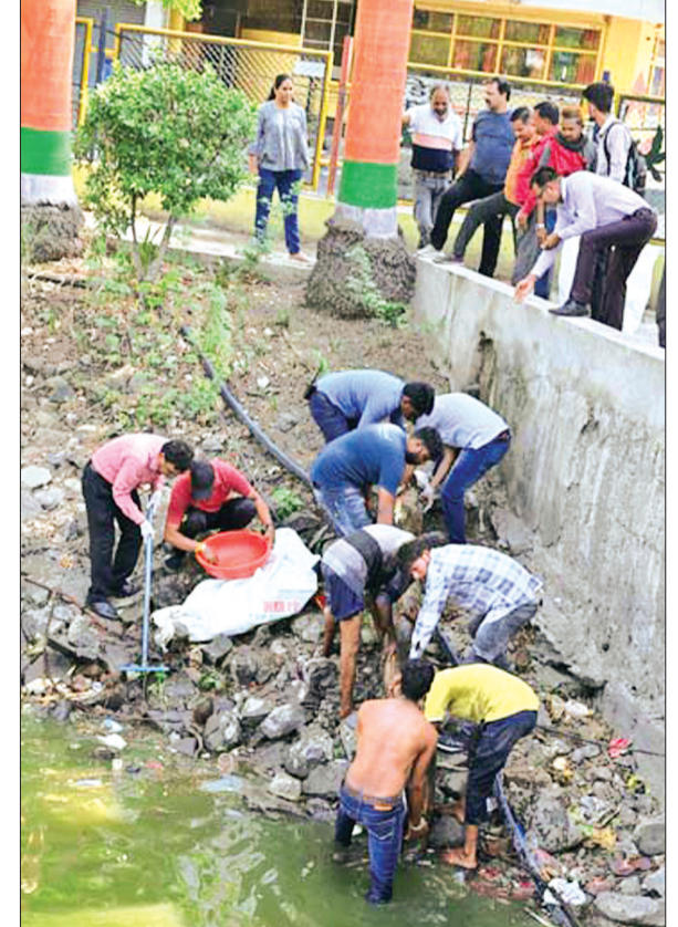
हरिभूमि न्यूज ►► देवास