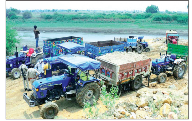
देवास। अवैध रेत से भरे ट्रैक्टर-ट्रालियों को किया जब्त